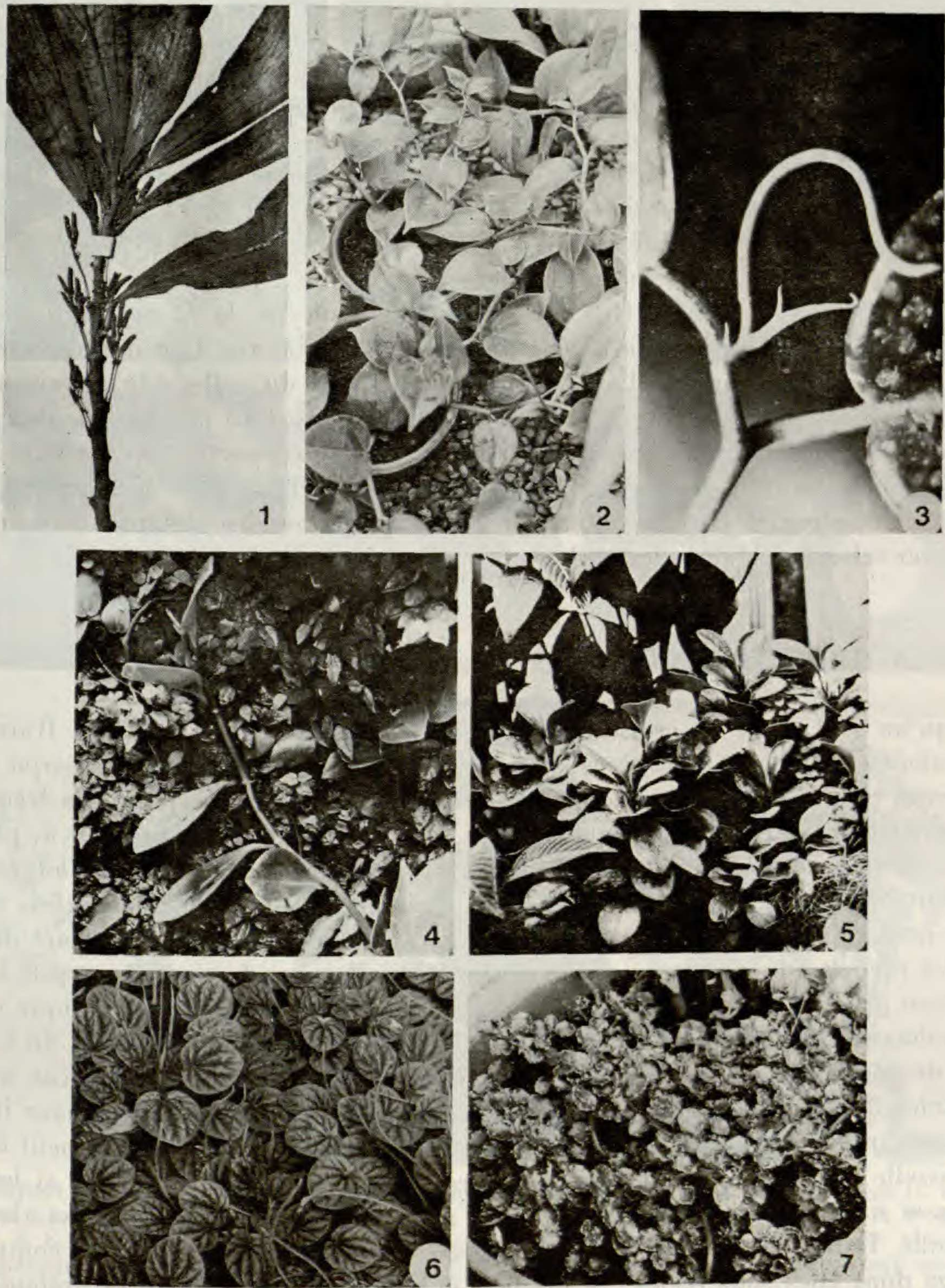
Pl. 1. — Aspect général de quelques espèces de Peperomia Ruiz & Pav. : 1, P. margaritifera Bertero : échantillon Bertero 1493 déposé au M.N.H.N. ; noter la tendance à la cauliflorie ; 2 et 3, P. scandens Ruiz & Pav. cultivé dans les serres du M.N.H.N. : 2, le port est rampant et l'extrémité des tiges est redressée ; 3, cyme terminale de deux spadices entourés dans les stades jeunes par une bractée à fonction protectrice de spathe ; relais de croissance apparaissant à l'aisselle de la dernière feuille assimilatrice ; 4 et 5, P. tithymaloides A. Dietr. cultivé dans les serres du M.N.H.N. : 4, plante peu ramifiée sur support vertical ; 5, plante ramifiée sur support horizontal ; 6, P. griseo-argentea Yun. cultivé dans les serres du M.N.H.N. : plantes acaules formant des touffes cespiteuses ; 7, P. reptilis C. DC. cultivé au laboratoire : port buissonnant de la plante.